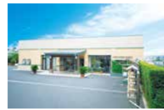
総合会館・管理事務所