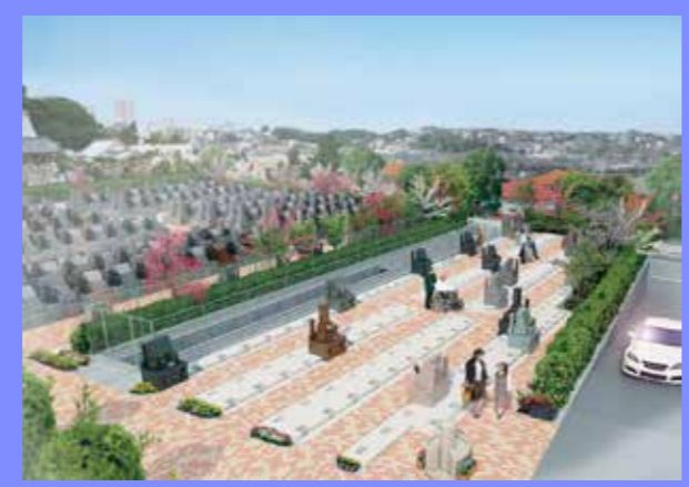
新区画完成予想パース

待望の最終区画がい よいよ開放！ 日当たり抜群の明る い区画です。 より良い区画はお早 めにお選び下さい！